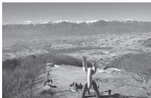
長峰山より安曇野、北アルプスを望む (2017年12月3日)

幼い頃の山の思い出と言えば、冬休みに兄と共に親父に連れられて地元の高峰に登ったおぼろげな記憶があります。高峰といっても北アルプスなど足元にも及びません。私の故郷は三重県津市、高峰とは経ヶ峰のこと、標高800m余りの平凡な山です。恐らく小学校低学年くらいだったでしょうが、小柄でひ弱な体にとっては、低山とはいえ真冬の山登りはつらいばかりで、あまり楽しいものではありませんでした。 それからの私は、運動と言えば地元の少年団の野球とか、中学校での部活のサッカーとか、(高校は帰宅部で、通学に自転車漕いだくらい…)、大学では何を血迷ったかラグビー部に入って楯円球に振り回されたりとか、とにかく球技ばかりで山にも海にも目をくれることはほとんどありませんでした。