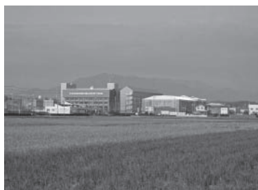
母校と経ヶ峰(2013年11月24日)