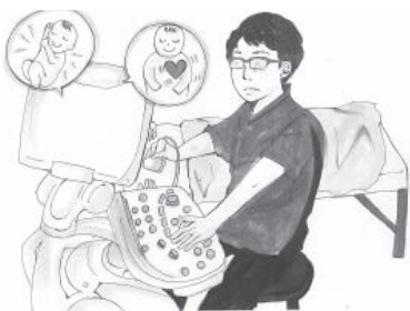
イラスト 北山典子

日頃、妊婦さんにごんばつて産みましようと言っている手前、今年も始まる夏山シーズンに向け、私もトレーニングを始めます。